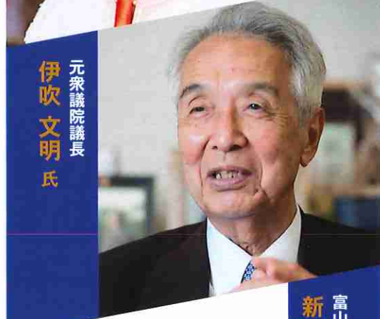
元衆議院議長 伊吹 文明氏