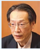
栗田 照久氏 金融庁長官

1963年、京都府出身。1987年京都大学法学部卒業。同年大蔵省(現・財務省)入省。1992年仙台国税局白河税務署長、2003年米スタンフォード大学客員研究員を経て2009年金融庁監督局証券課長。2011年総務企画局企業開示課長。2013年監督局銀行第一課長を経て2014年総務企画局総務課長。2016年監督局参事官、2018年監督局長。2022年総合政策局長。2023年金融庁長官。