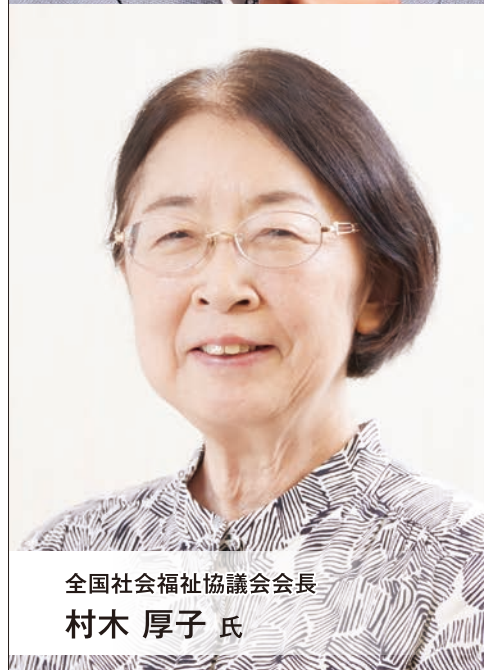
全国社会福祉協議会会長 村木 厚子氏