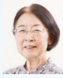
村木 厚子氏 全国社会福祉協議会会長

1964年山口県下関市出身。84年、ロサンゼルス五輪の野球「日本代表」チームで左投手の切り札として優勝に貢献した。翌85年にドラフト3位でプロ野球巨人軍入団、先発から抑えまでこなし、97年まで通算成績は66勝62敗4セーブ、防御率3・60。89年のペナントレースと日本シリーズ、翌90年のペナントレース優勝の計3回、胴上げ投手も経験した。引退後、タレントに転身。2019年~2021年まで巨人軍投手チーフコーチとして活躍し、2022年より巨人軍女子野球チーム初代監督に就任。