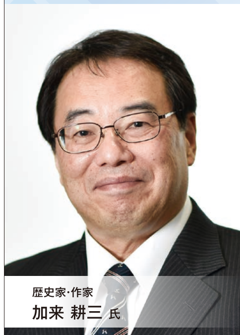
歴史家・作家 加来 耕三氏