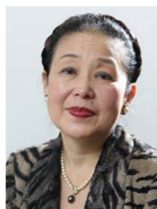
理事長 南 紗 (読売新聞東京本社常務取締役調査研究担当)

TEL (03) 3216-8711 FAX (03) 5200-1881 E-mail: ty-kikou@yomiuri.com