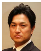
高橋 由伸氏 ◎読売巨人軍