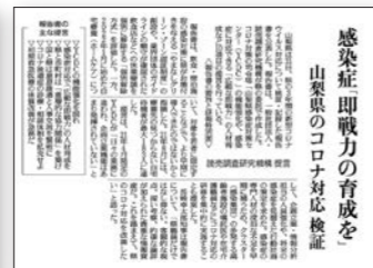
報告書と読売新聞に掲載された関連記事の例